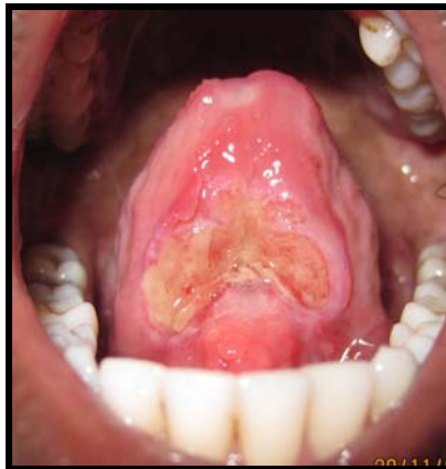
நாக்கில் ஆறாத புண்

2) வாயின் உட்புறத்தில் அல்லது நாக்கில் ஏற்படும் ஆறாத புண்.