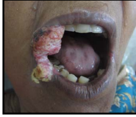
முற்றிய நிலை வாய் புற்றுநோய்